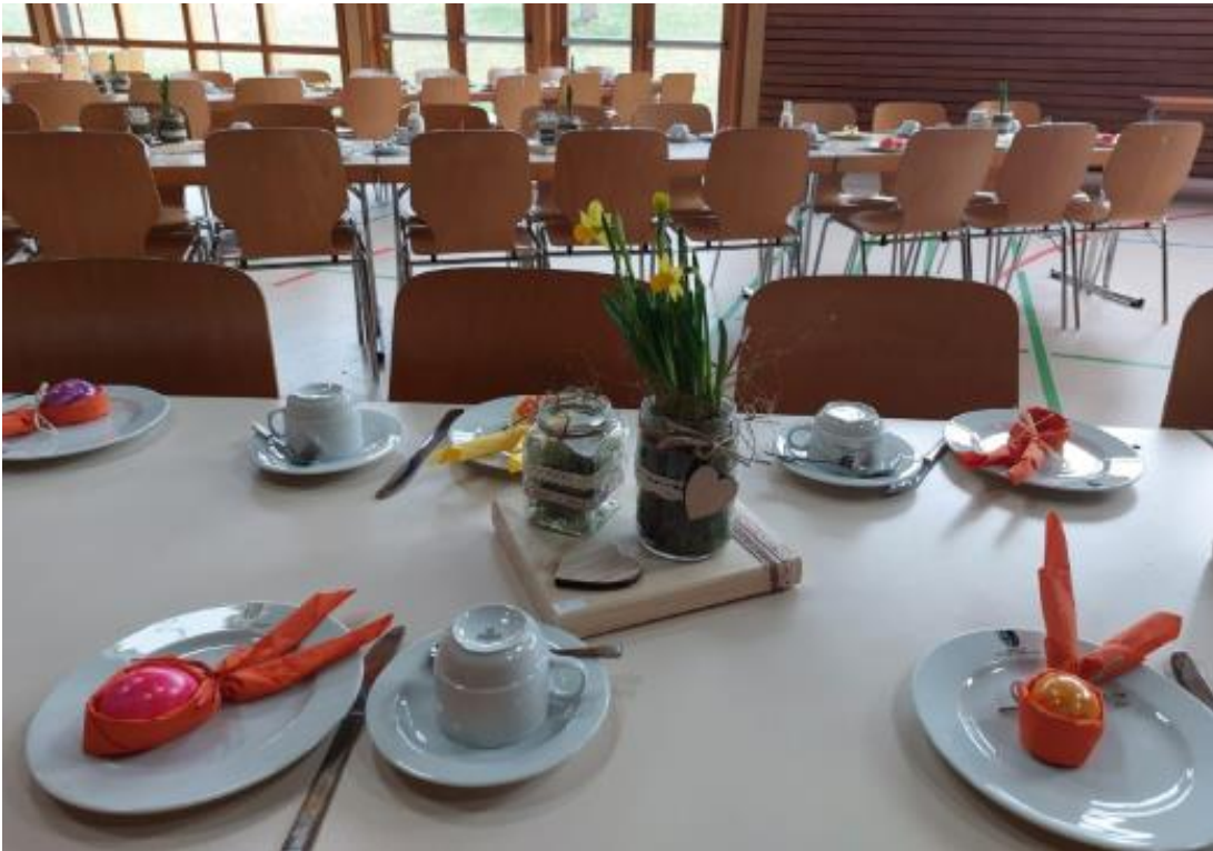
Die Tische sind gedeckt .... ... und es ist angerichtet...